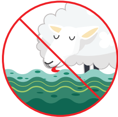
Beber el agua

Si usted cree que hay proliferación cianobacteriana, no permita que sus mascotas o su ganado hagan lo siguiente: