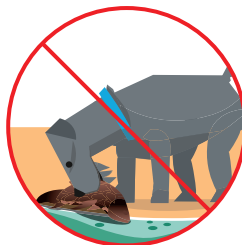
Comer animales muertos, como pescados, que hayan encontrado cerca de la proliferación