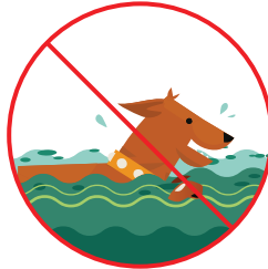
Nadar o jugar en el agua