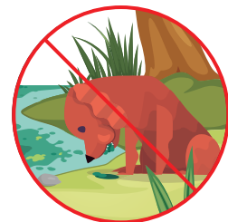
Comer capas de Cyanobacteria