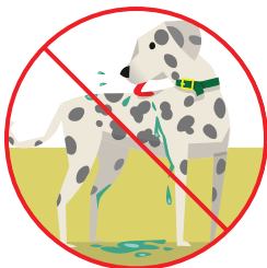
Lamerse el pelaje después de estar en el agua