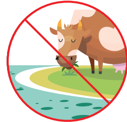
Comer cerca del agua